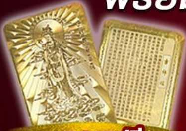
แถมฟรี แผ่นทองเจ้าแม่กวนอิม