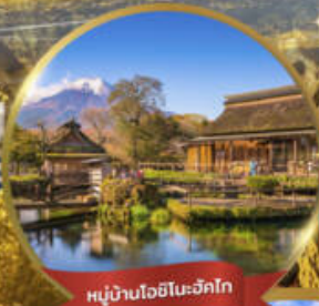
หมู่บ้านโอชิโนะซึกโก