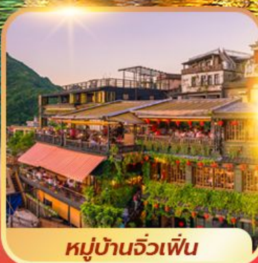
หมู่บ้านจิวเฟิน