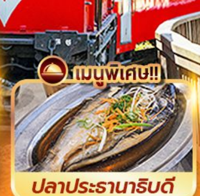
เมนูพิเศษ!!