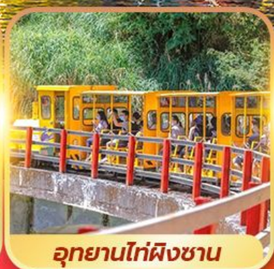
อุทยานไท่ผิงซาน