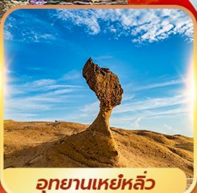
อุทยานเหยหลิว