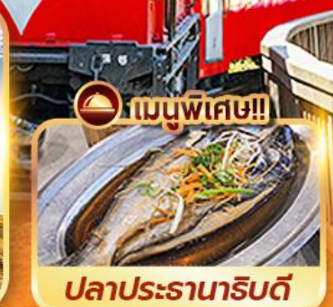
เมนูพิเศษ!! ปลาประรานาธิบดี