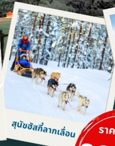
สุนัขฮัสกี้ลากเลื่อน