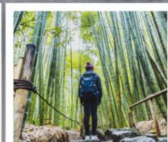
วัดโฮคะคุจิ