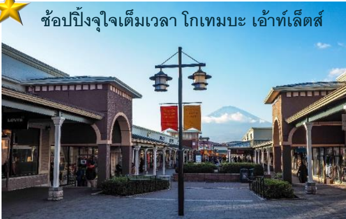
ช้อปปิ้งจุใจเต็มเวลา โกเทมบะ เอ้าท์เล็ตส์