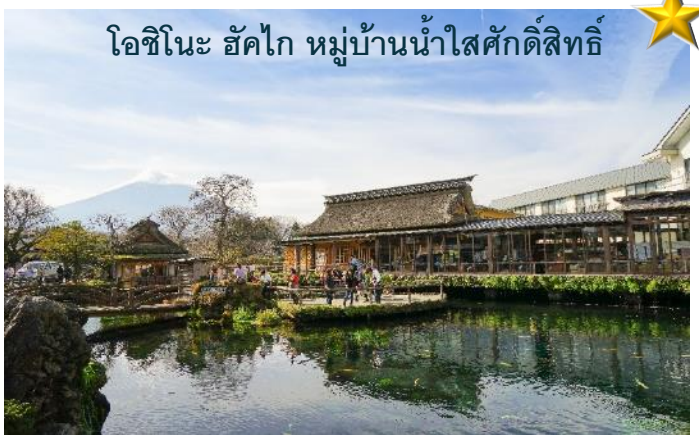
โอชิโนะ ฮัคไก หมู่บ้านน้ำใสศักดิ์สิทธิ์