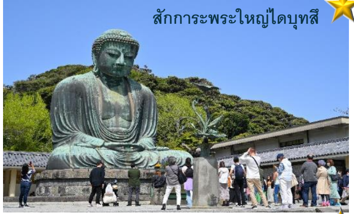
สักการะพระใหญ่ไดบุทสึ