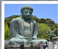
วัดโคโตคุอิน