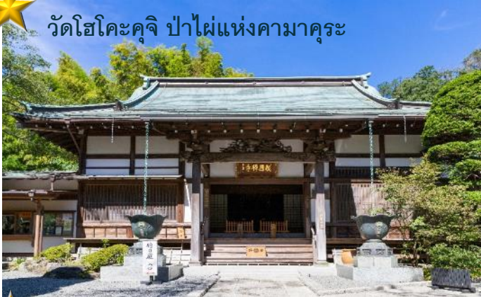
วัดโฮโคะคุจิ ป่าไม้แห่งคามาคูระ