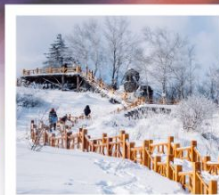
เขากะหล่ำ