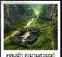
อุทยานแห่งชาติฟางผานฮวงตี้