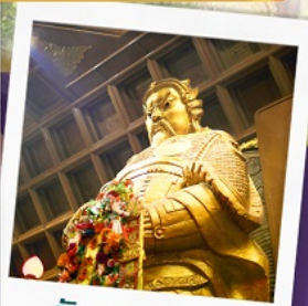
วัดเขาภกษิมิว