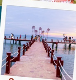
Sunset Sanato Beach Club