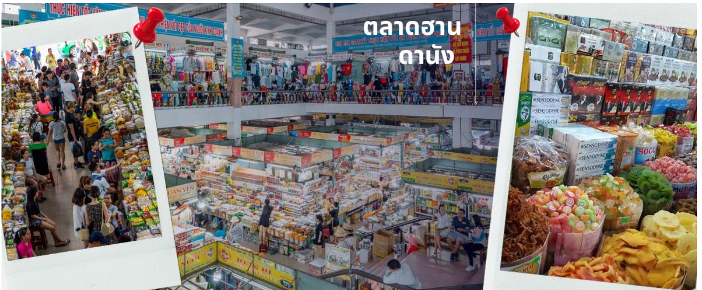
ตลาดฮาน ดานัง

นำท่านไปละลายทรัพย์ที่ ตลาดฮาน เป็นตลาดที่รวบรวมสินค้ามากมายเป็นที่นิยมทั้งชาวเวียดนามและชาวไทย อาทิ เสื้อเวียดนาม หมวก รองเท้า กระเป๋า สินค้าพื้นเมือง โดยเฉพาะงานฝีมือ อาทิ ภาพผ้าปัก มืออันวิจิตร คอมไฟ ผ้าปัก กระเป๋าปัก ตะเกียบไม้แกะสลัก ชุดอ่าวหย่าย (ชุดประจำชาติเวียดนาม) ฯลฯ ไว้เป็นที่ระลึกมากมายเพื่อฝากคนที่บ้าน