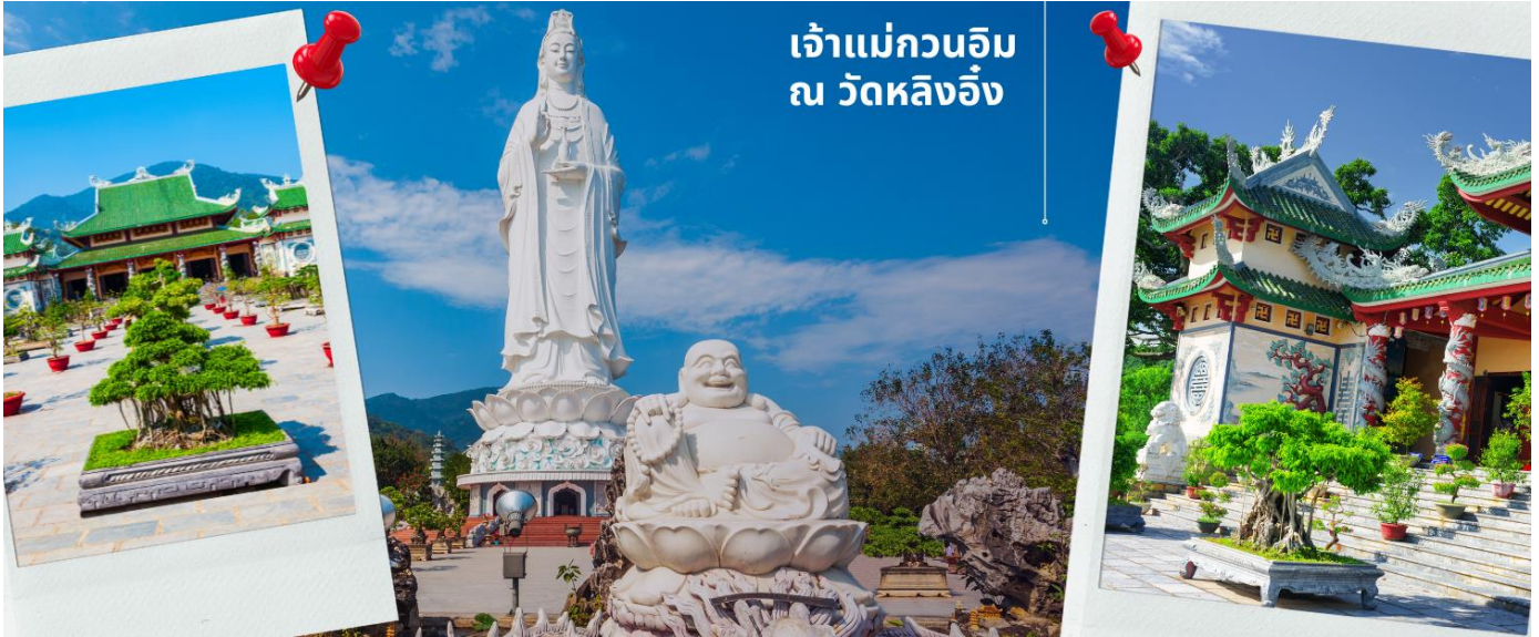
เจ้าแม่กวนอิม ณ วัดหลิงอิ่ง

นำท่านนมัสการองค์ เจ้าแม่กวนอิม ณ วัดหลิงอิ่ง อยู่บนเกาะเซินตรา (Son Tra) ทางเหนือของเมืองดานัง เป็นวัดใหญ่ที่สุดของที่นี่ รูปปั้นปูนขาวของเจ้าแม่กวนอิมยืนหันหลังให้ภูเขา หันหน้าออกสู่ทะเลเพื่อเป็นการปกป้องคุ้มครองชาวประมงที่ออกไปหาปลา เสียงระฆังวัดที่ตีประสานกับเสียงคลื่นนั้นช่วยให้ชาวเรือรู้สึกสงบ และสร้างขวัญกำลังใจอย่างดีเยี่ยม และเป็นทีเคารพนับถือของคนดานัง