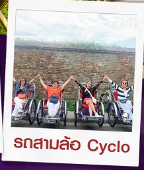
รถสามล้อ Cyclo