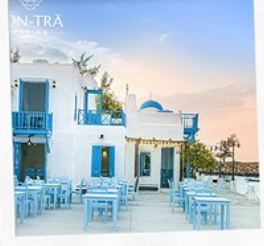
ซานตารีน้ำกาแฟ