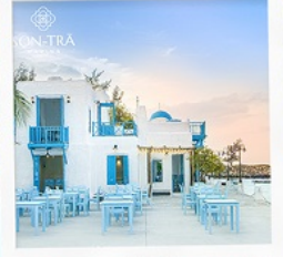
ซานตารีนาคาเฟ่