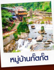
หมู่บ้านก๊ตก๊ต