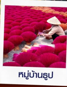
หมู่บ้านรูป