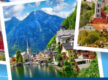
เมืองฮอลสตัดท์