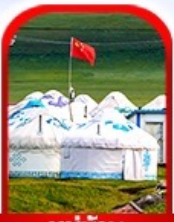
หมู่บ้าน พื้นเมือง