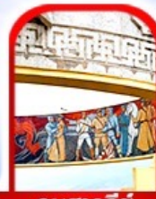
อนุสาวรีย์ โซซาน