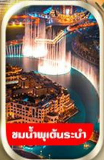
ชมน้ำพุต้นระบำ

นั่งรถ 4WD ชมทะเลทรายอาหาร พร้อมทานดินเนอร์อาราเบีย