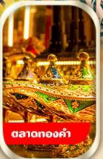
ตลาดทองคำ