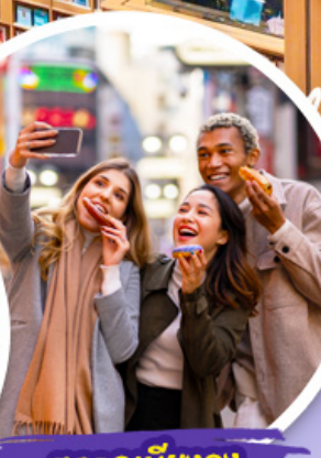
ตลาดเมียงดง