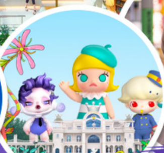
ช้อปบิง POP MART