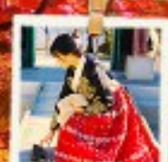
ใส่ชุดฮันบก