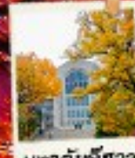
เมฆาคับชิววา