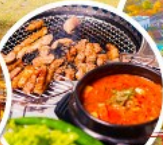
ตัวอย่างเกาหลี