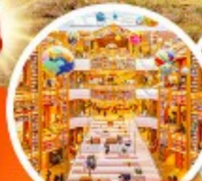
ห้องสมุดสตาร์ฟิสต์

• พิเศษ!! ใส่ชุดฮันบกเดินวัง + ถนนสายโรแมนติกที่อกซุกุง