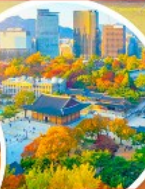
พระราชวังเคียงอกซุกุง