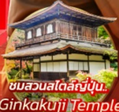
ชมสวนสโตนี่ญี่ปุ่น.. Ginkakuji Temple