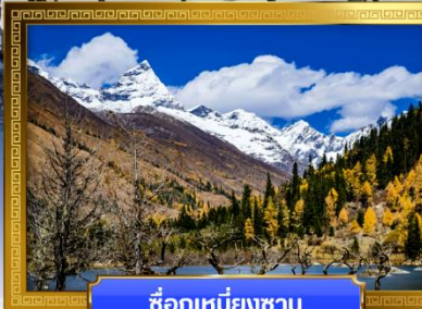
ชื่อภูเขาหิมะชาน