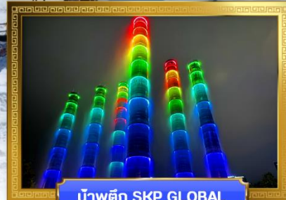
น้ำพุตึก SKP GLOBAL