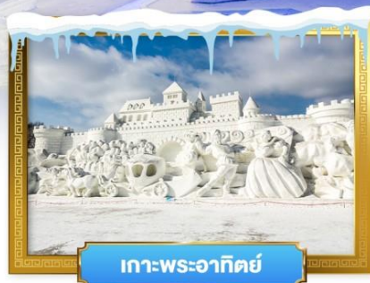
เกาะพระอาทิตย์