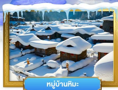
หมู่บ้านหิมะ