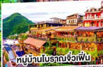
หมู่บ้านโบราณจิวเฟิ่น