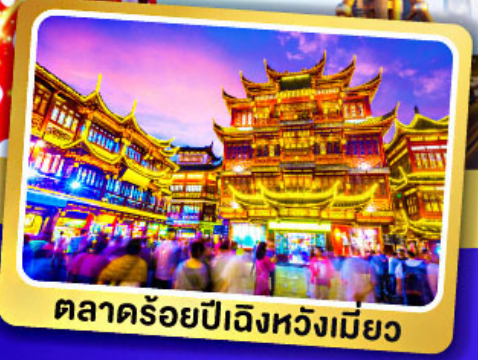
ตลาดร้อยปีเจิ้งหวังเมี่ยว