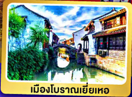
เมืองโบราณเยี่ยเหอ