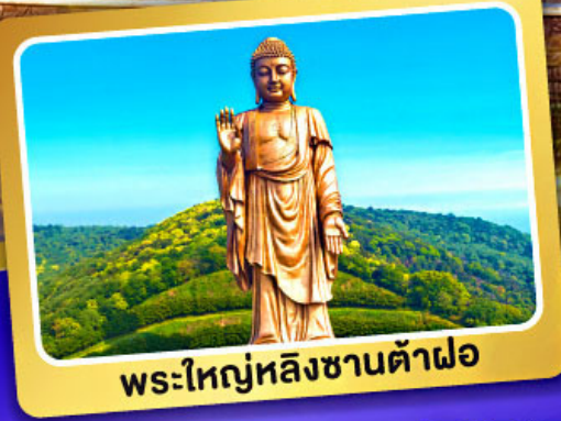
พระใหญ่หลังซานต้าฝอ