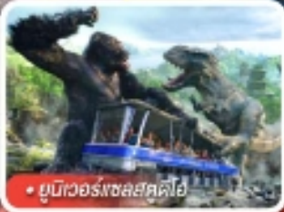
ยูนิเวอร์สอลสตูดิโอ