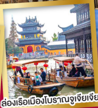
ล่องเรือเมืองโบราณจูเจียเจียว