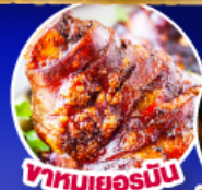
พาหมูเยอรมัน