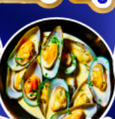
หอยแมลงภู่อินทรีย์