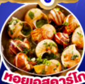
หอยเอสคาร์โก