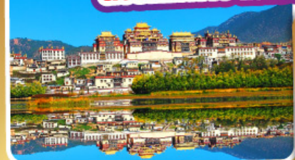
วัดลามะชงจ้านหลิง