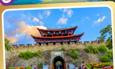
เมืองโบราณต้าหลี่