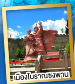
เมืองโบราณชงพาน