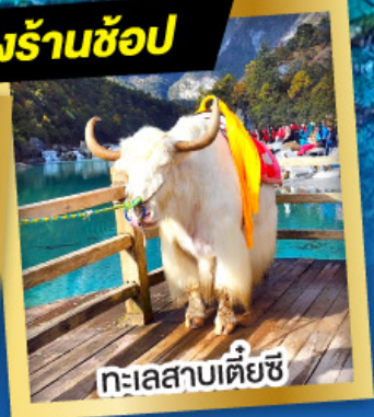
ทะเลสาบเตี้ยซี