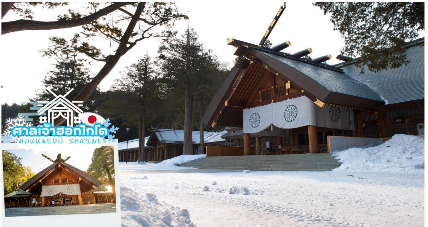
ศาลเจ้าฮอกไกโด HOKKAIDO SHRINE

นำท่านช้อปปิ้ง ร้านปลอดภาษี (Duty Free) จำหน่ายของฝากของที่ระลึกปลอดภาษี ที่อยู่ไม่ไกลจากตัวเมืองซัปโปโร ภายในมีสินค้าลดราคามากมาย ให้ท่านได้อิสระเลือกซื้อสินค้าภายในร้าน เช่นขนม เครื่องสำอาง ของที่ระลึก และสินค้าอื่นๆอีกมากมาย