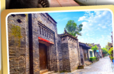
ถนนคนเดินชอยกว้างชวยแคบ