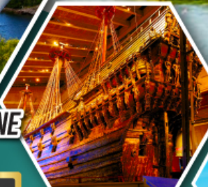
น้ำพุแห่ง ราชินีเดฟ็อน