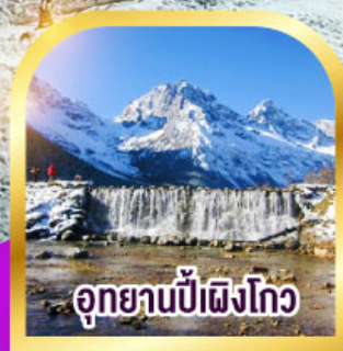
อุทยานป่าเผิงโกว