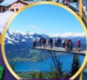
ยอดเขา ฮาร์เตอร์คลุม