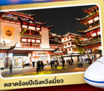
ตลาดร้อยปีเจิ้งหวิงเมี่ยว