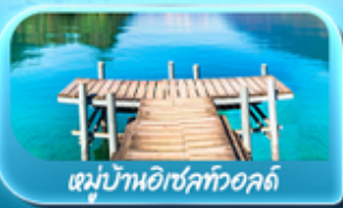
หมู่บ้านอิเชิลทอลล์