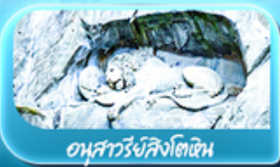
อนุสาวรีย์สิงโตหิน