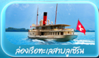
คลองเรือทะเลสาบลูเซิร์น

ซูริก โลซาน เวเวย์ เซอร์แมท ลูเซิร์น ริก