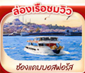
ล่องเรือชมวิว