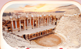
เมืองโบราณฮิยราโพลิส