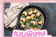
เมนูพิเศษ หอยเอสคาโท

เยอรมัน เนเธอร์แลนด์ เบลเยียม ฝรั่งเศส Keukenhof