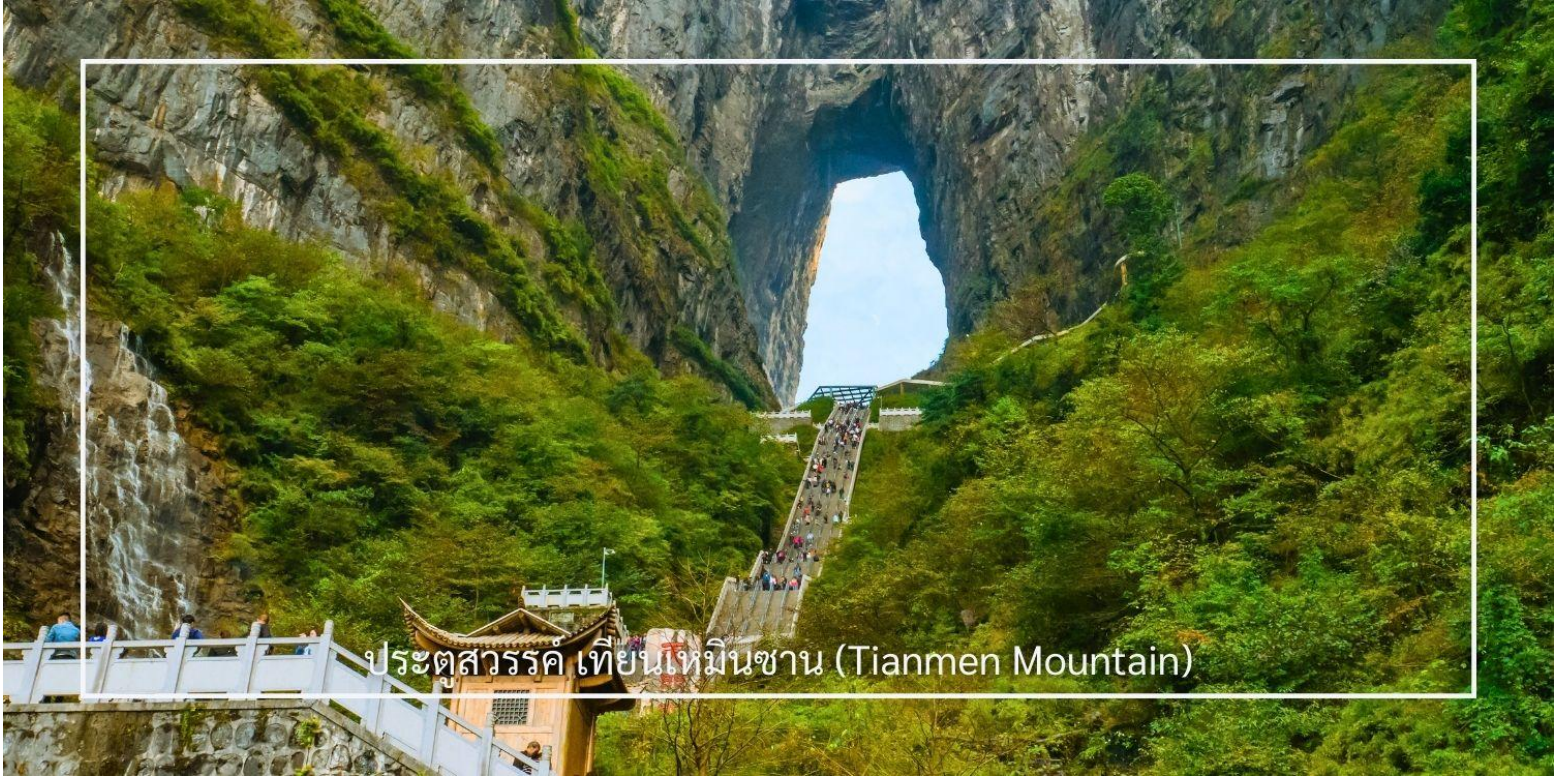
ประตูสวรรค์ เทียนเหมินซาน (Tianmen Mountain)

เสียดฟ้า เมื่อถึงยอดเขาเทียนเหมินซาน นำคณะเดินตามเส้นทางชมวิวเลียบภูเขาและหน้าผา ชมทัศนียภาพจากมุมสูงบนยอดเขา ทำท่ายความกล้าของท่านด้วยการเดินบนพื้นกระจกใสของ ระเบียงแก้ว กระจกใสเลียบหน้าผา จากนั้นนำท่านสู่ ประตูสวรรค์ โดย บันไดเลื่อนที่สร้างขึ้นโดยการเจาะทะลุภูเขาที่เรียงติดต่อกันถึง 5 ตอน เป็นเครื่องอำนวยความสะดวกใหม่ล่าสุดของ เขาเทียนเหมินซาน ท่านจะได้ถ่ายภาพ ประตูสวรรค์ อย่างใกล้ชิด