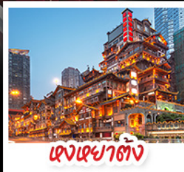
ตึกฟูหยาดัง