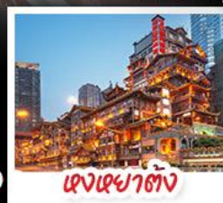
แดงหยาดัง