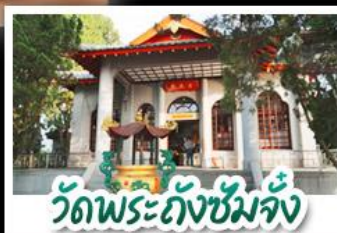
วัดพระถังซัมจั๋ง