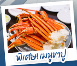
พิเศษ! เมฆหิมะ