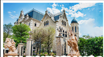
NINA CHOCOLATE CASTLE

ทะเลสาบสุริยันจันทรา - ไทเป 101 จิวเฟิ่น - NINA CHOCOLATE CASTLE MONSTER VILLAGE - ชิเหมินต้ง เมนูพิเศษ ปลาประจานาธิบดี เซี่ยวหลงเปา / ซาบูไต่หวั่น