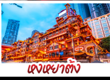
แดนเฉิงชิ่ง