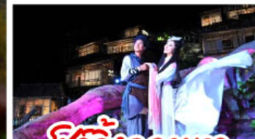
ซิ่วจิ้งจอกขาว