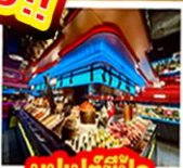
บูฟเฟต์ซีฟู้ด