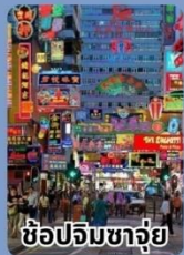
ช้อปปิ้งชาจู่ย