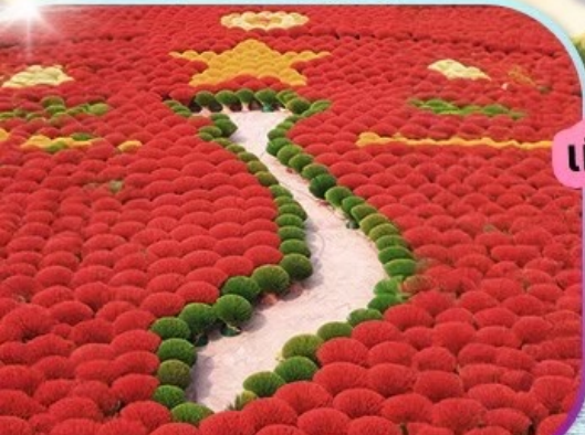
หมู่บ้านรูป