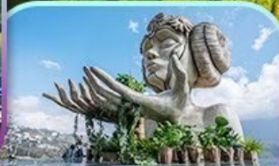
Moana Sapa Cafe