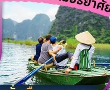
นั่งเรือกระจาด