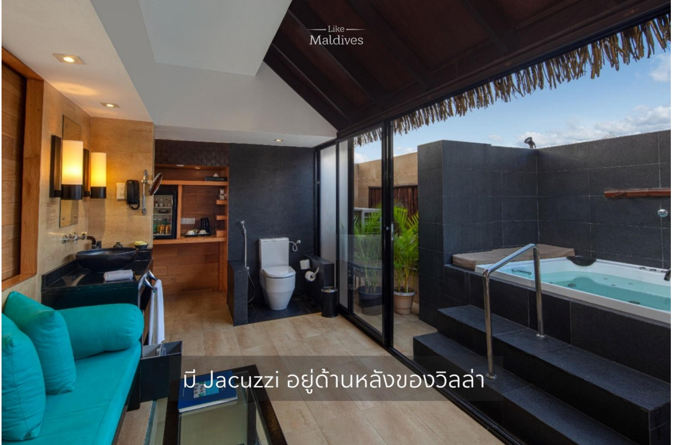
มี Jacuzzi อยู่ด้านหลังของวิลล่า