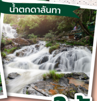
น้ำตกดาลันทา