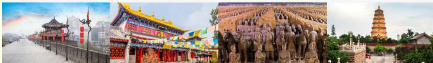
กำแพงเมืองโบราณ